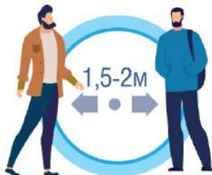
СОБЛЮДАЙТЕ РАССТОЯНИЕ И ЭТИКЕТ