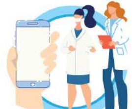
В СЛУЧАЕ ЗАБОЛЕВАНИЯ ОБРАЩАЙТЕСЬ К ВРАЧУ